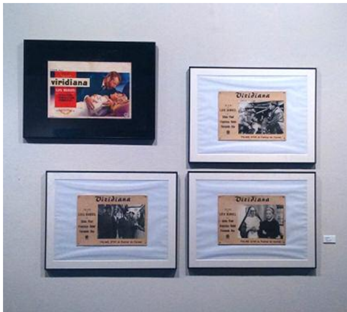
La exposición se completa con diez lobby cards, es decir, las carteleras promocionales de los cines ProjectAragón

la provincia de Teruel para convertirse en un plató de cine han sido tenidas en cuenta por las productoras desde hace años. Las localidades de Albaracín y Calomarde sirven estos días de escenario para la grabación de la superproducción de Hollywood The promise , pero otros municipios turolenses ya han sido el marco elegido para rodar en otras ocasiones.