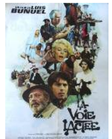
'La Vía Láctea' está también presente