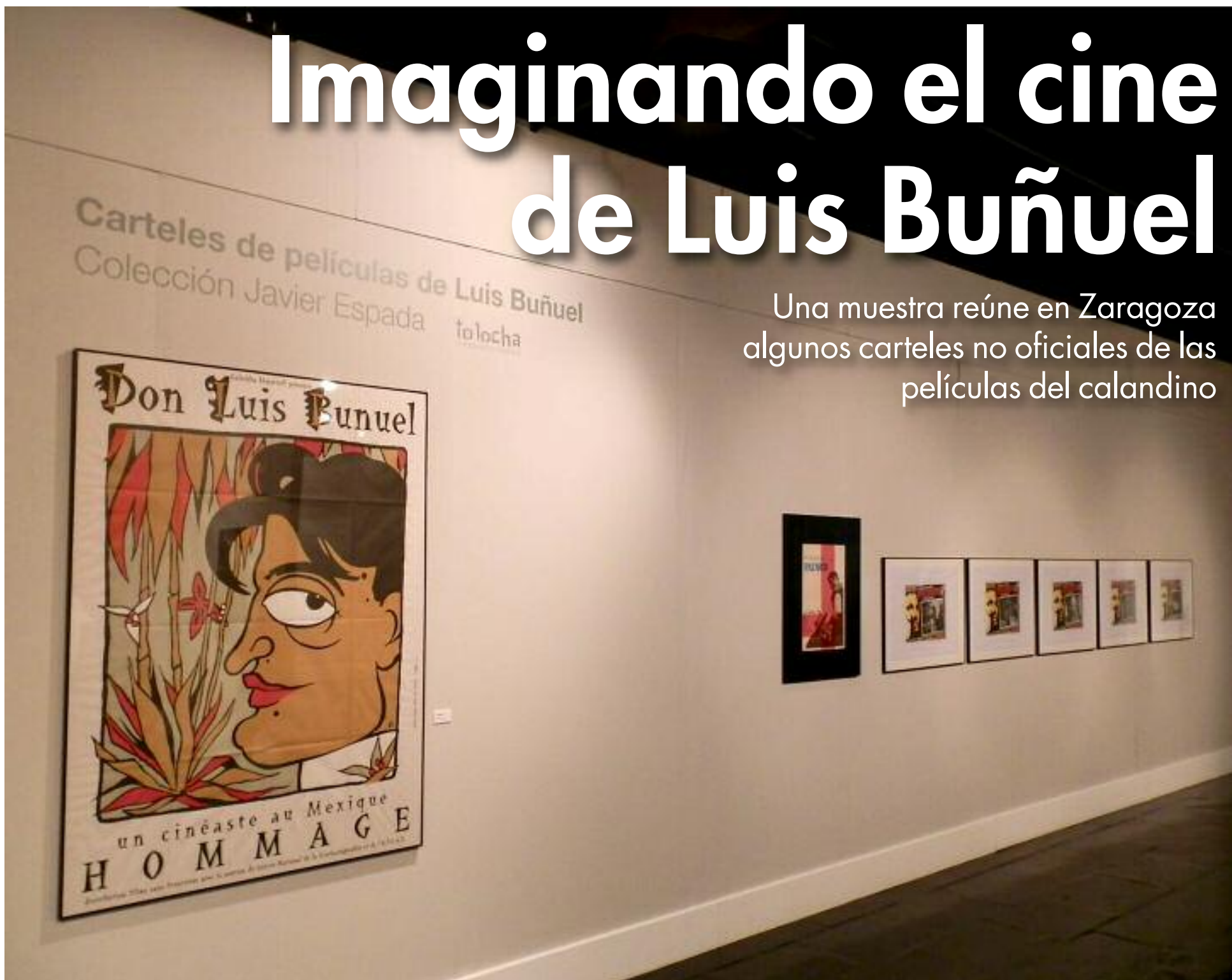
Vista general de la Sala CAI Luzán de Zaragoza, que acoge la muestra de los carteles de las películas hasta el próximo 15 de octubre.

Una muestra reúne en Zaragoza algunos carteles no oficiales de las películas del calandino