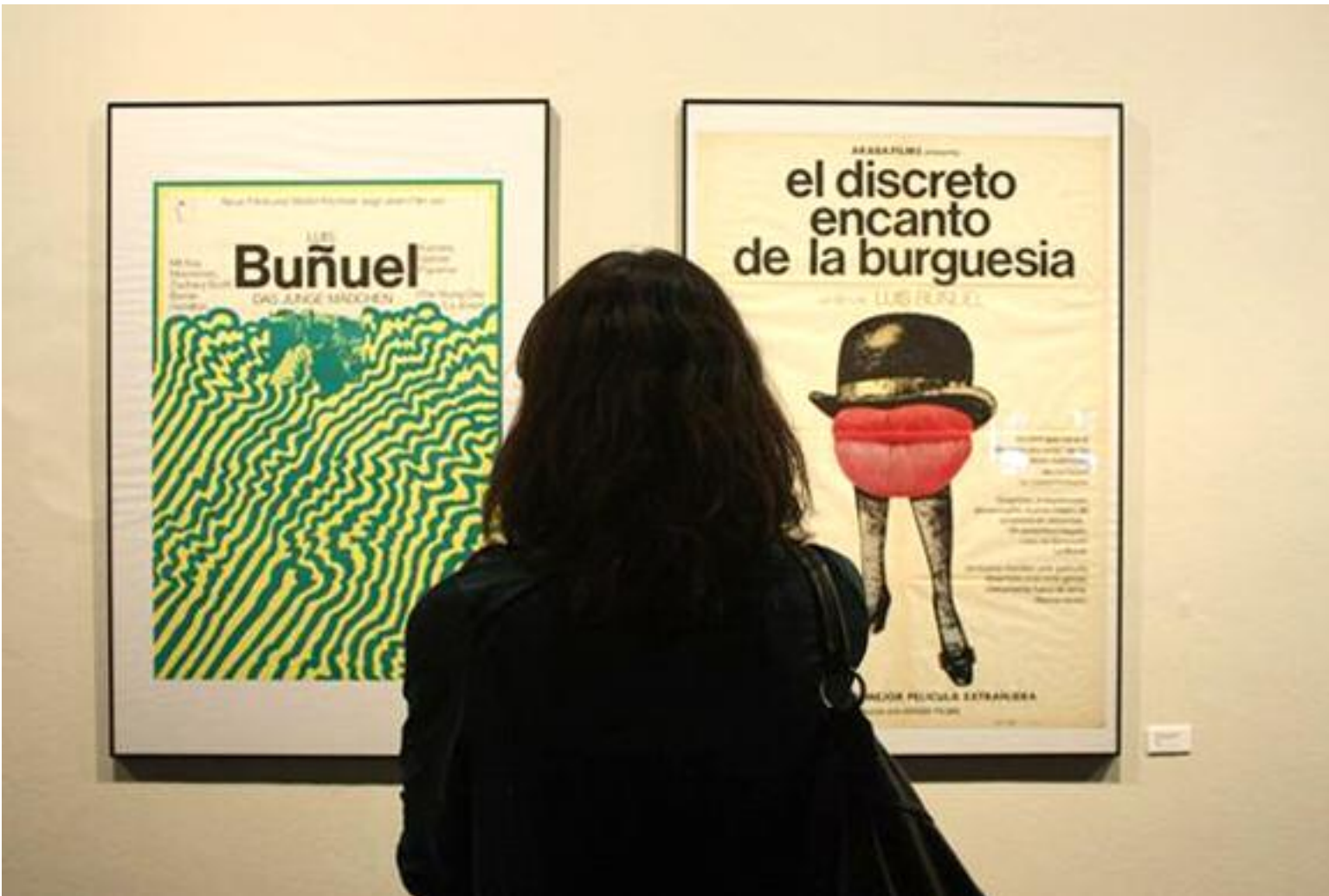
Los carteles que forman parte de la exposición se encuentran en diferentes idiomas, dado que han sido realizados en ocho países. ProjectAragón