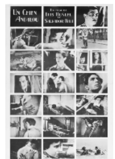
Cartel de 'Un perro andaluz'