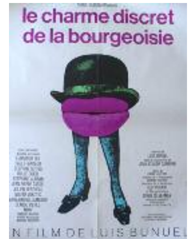
El discreto encanto de la burguesía